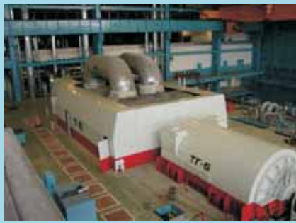
Турбина нового энергоблока

“Это уникальный пуск истории сегодняшней России. В кратчайшие сроки сделаны технологические работы объема беспрецедентного для страны, качества, о котором и запад может только мечтать, при совместном финансировании акционеров и разумной тарифной политике, поддержанной местной администрацией”.