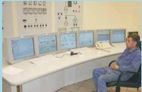
АРМ машиниста энергоблока

АСУТП энергоблока на базе ПТК «Торнадо-М» имеет функционально и территориально распределенную архитектуру. ПТК системы построен по традиционной двухуровневой иерархии.