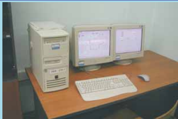
Один из АРМ инженеров

Каждый АРМ оснащен специализированным программно-аппаратным обеспечением, оптимизированным для выполнения поставленных задач.